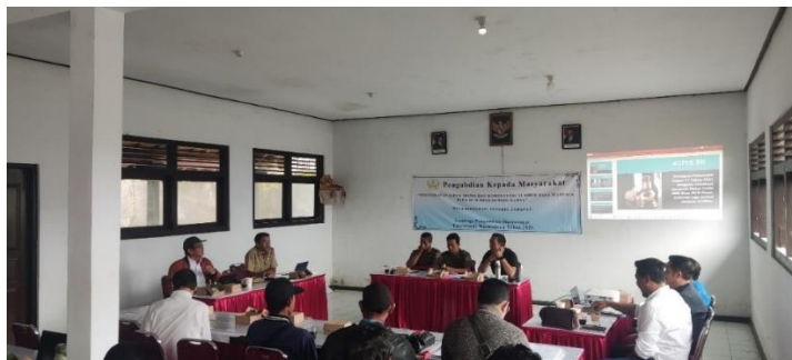
Gambar 2. Sosialisasi Pendaftaran NIB.

penggunaan sistem OSS RBA. (4) Sosialisasi manfaat NIB sebagai legalitas usaha yang dapat membuka akses modal, kerja sama bisnis, dan perlindungan hukum, dengan pembuatan materi edukasi yang mudah dipahami. (5) Pendampingan langsung dalam setiap tahapan pendaftaran dan monitoring keberhasilan proses pendaftaran NIB agar tidak terjadi hambatan administratif.