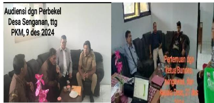
Gambar 1. Penjajakan awal dengan mitra pada tanggal 9 Desember 2024 dan 21 Desember 2024.

Approach (OSS RBA). Pemerintah telah menetapkan bahwa setiap bentuk badan usaha, termasuk Bum Desa, diwajibkan untuk memiliki NIB sebagai salah satu syarat dasar untuk menjalankan kegiatan usaha yang sah (Suryo Wibowo & Sulistya Hapsari, 2022). Ketidakhadiran NIB mengakibatkan Bum Desa tidak dapat mengakses permodalan, kemitraan bisnis, serta program bantuan pemerintah yang sangat penting untuk keberlanjutan usaha mereka (Mustofa et al., 2022).