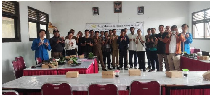
Gambar 3. Foto Bersama Perangkat Desa Senganan, Penebel Tabanan.

Dengan pendekatan metodologis tersebut, diharapkan Bum Desa Semedi Karya dapat mengatasi hambatan yang selama ini menghalangi proses perizinan usaha, sehingga dapat memperoleh NIB secara sah dan menjalankan usahanya dengan landasan hukum yang kuat. Selain itu, keberlanjutan program ini akan memastikan bahwa pengelola Bum Desa memiliki kemampuan mandiri dalam mengelola perizinan usaha di masa mendatang, sekaligus mendorong pertumbuhan usaha desa yang berkelanjutan dan memberikan manfaat ekonomi yang lebih luas bagi masyarakat Desa Senganan, Penebel, Tabanan.