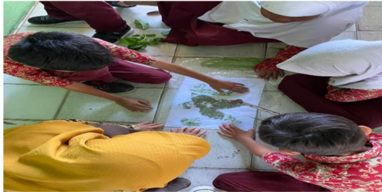
Gambar 3. Pembuatan proyek berbasis ecoprint .