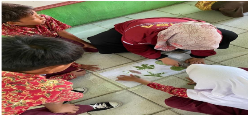
Gambar 2. Demonstrasi kegiatan proyek berbasis ecoprint

berbasis ecoprint . Kegiatan apersepsi dilakukan dengan memberikan pemahaman tentang ecoprint , alat dan bahan proyek ecoprint , dan tahapan pembuatan produk ecoprint . Setelah dilakukan apersepsi dengan menggunakan metode ceramah, kegiatan selanjutnya ialah demonstrasi proyek ecoprint , guru memperlihatkan semua alat dan bahan proyek ecoprint kemudian mendemonstrasikan cara pengimplikasian semua media dan alat ecoprint sampai menjadi sebuah produk ecoprint .