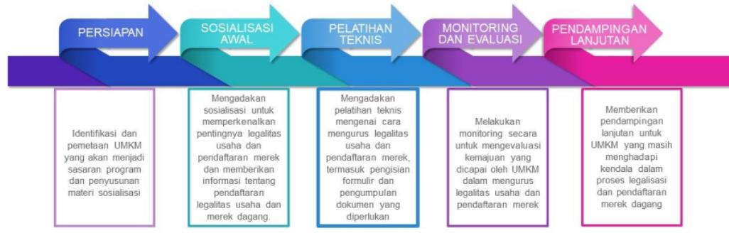
Gambar 3. Tahapan-tahapan Kegiatan Pengabdian Masyarakat

Berdasarkan tabel tersebut pada tahap persiapan terlebih dahulu dilakukan Identifikasi dan pemetaan UMKM yang akan menjadi sasaran program kemudian pemateri melakukan penyusunan materi untuk diberikan kepada peserta UMKM pada saat sosialisasi. Tahap selanjutnya merupakan sosialisasi awal yaitu mengadakan sosialisasi untuk memperkenalkan pentingnya legalitas usaha dan pendaftaran merek dan memberikan informasi tentang pendaftaran legalitas usaha dan merek dagang kemudian dilanjutkan dengan pelatihan teknis mengenai cara mengurus legalitas usaha dan pendaftaran merek, termasuk pengisian formulir dan pengumpulan dokumen yang diperlukan serta melakukan pendampingan langsung kepada UMKM dalam proses pendaftaran. Setelah dilaksanakan sosialisasi awal dan pelatihan teknis tim melakukan monitoring dan evaluasi mengenai kemajuan yang dicapai oleh UMKM dalam mengurus legalitas usaha dan pendaftaran merek dan tahap terakhir yaitu pendampingan lanjutan dengan cara memberikan pendampingan lanjutan untuk UMKM yang masih menghadapi kendala dalam proses legalisasi dan pendaftaran merek dagang.