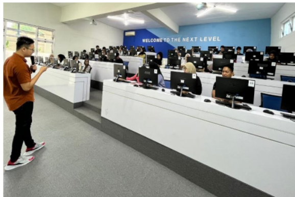
Gambar 8. Penjelasan Mengenai Branding Pada Produk UMKM