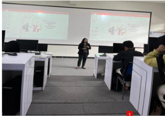
Gambar 4. Pemaparan materi mengenai Legalitas Usaha dan Pendaftaran Merek Dagang