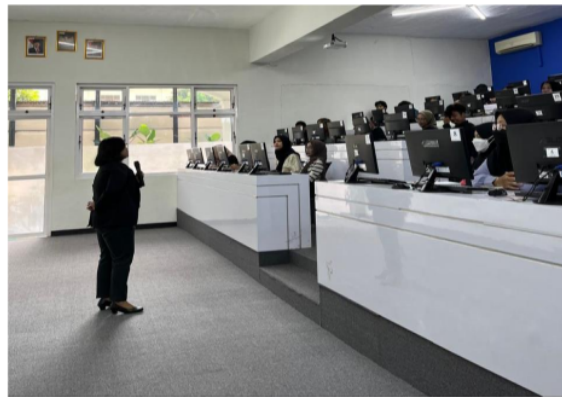
Gambar 5. Peserta Sosialisasi Diberikan Pemahaman mengenai Badan Usaha