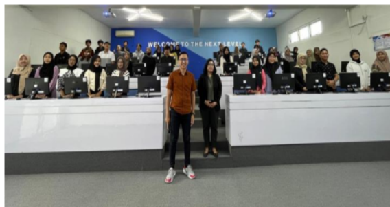
Gambar 9. Narasumber dan Peserta Sosialisasi Legalitas Badan Usaha dan Pendaftaran Merek Dagang Dalam Upaya Meningkatkan Penjualan Produk UMKM di Wilayah Banyumas