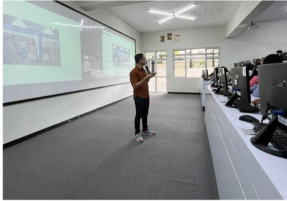
Gambar 7. Penjelasan mengenai UMKM dan Upaya Meningkatkan Penjualan Produk UMKM