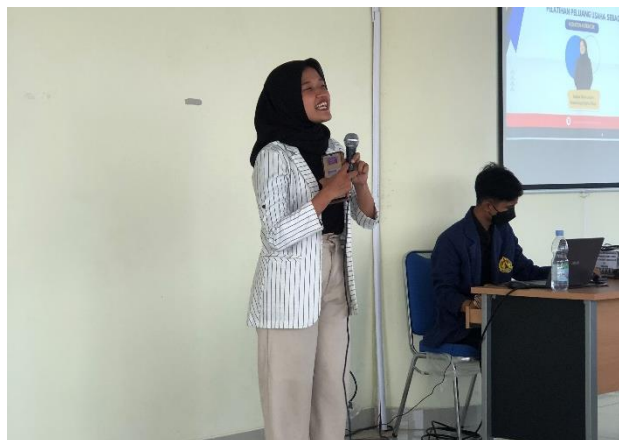
Gambar 1.1 Sesi pemaparan materi oleh pembicara

Berdasarkan tabel diatas ..... (deskripsi hasil spss)