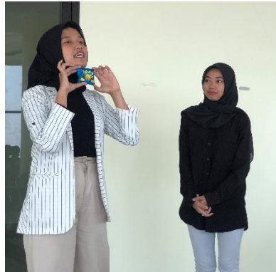
Gambar 1.2 Sesi Praktik mempromosikan produk

Gambar diatas, merupakan dokumentasi saat pembicara memberikan materi yang berhubungan dengan konten kreator dan marketing digital dan memberikan sedikit contoh yang relevan.