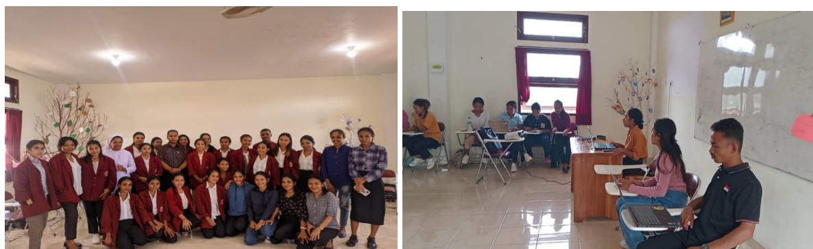
Gambar 3: Hasilnya memastikan bahwa cerpen “Hawa Panas”

Tindakan berbela rasa yang terungkap dalam kutipan di atas menunjukkan kecermatan pemimpin dengan konsep mengkalukulasi kerugian, mengidentifikasi risiko, membuat keputusan yang lebih informasional, lebih disaring, membuat perhitungan yang tepat untuk penyaluran bantuan itu yang secara matematis konsep ini mendapat jawaban pasti dan berdampak luas bagi warga. Selain itu, melalui tindakan ini peran sosial memberi perhatian, empati, dan peduli terhadap keadaan dan kondisi masyarakat yang mengalami musibah terlaksana dengan terlebih dahulu secara matematis membuat keputusan yang lebih informasional, lebih disaring, dan justru tindakan langsung seperti ini dengan solusi yang tepat ini, dengan logika dan nalar yang konsisten mengundang reaksi positif dan simpati warga untuk terus mendukung program yang dirancang para pemimpin.