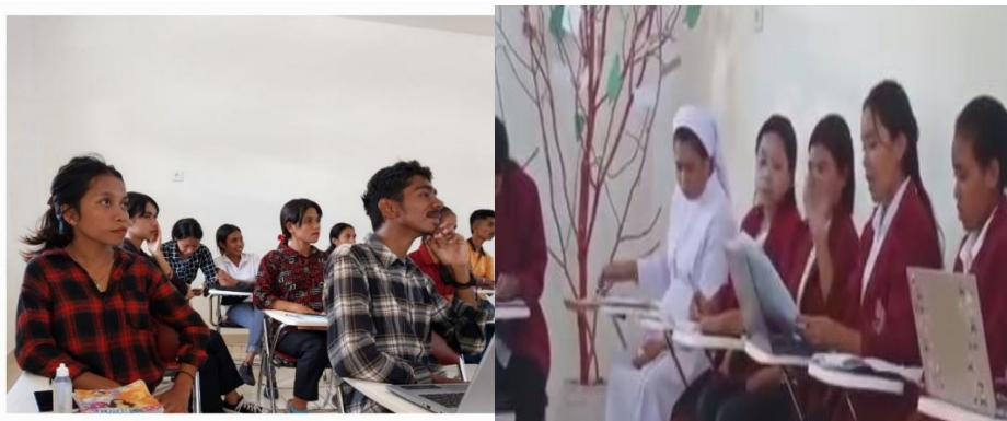
Gambar 1: Kelompok penyaji menyampaikan materi teknik dramatik dalam mengkaji cerpen yang dihadiri kelas diskusi kolaborasi antar prodi PBSI dan Matematika.

(Nurgiyantoro, 2018) menjelaskan kelebihan penggunaan teknik dramatik ialah pembaca diberikan kesempatan untuk dapat aktif dalam menafsirkan kedirian tokoh dalam cerita, sehingga pembaca dapat melibatkan diri secara aktif, kreatif, dan imajinatif karena dapat menginterpretasikannya sesuai dengan realitas kehidupan nyata, dan mengundang pembaca untuk menafsirkan sifat-sifatnya melalui kata-kata dan perannya serta, tindakannya.