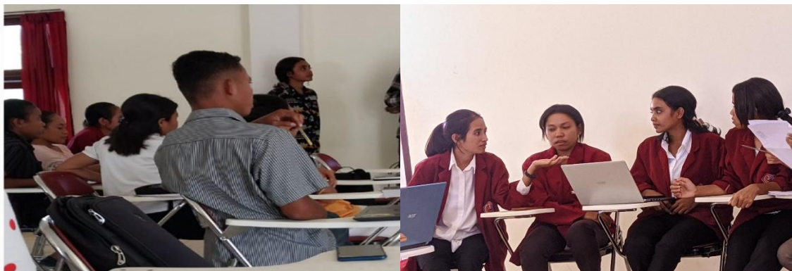
Gambar 2: Semangat berdiskusi menemukan peran tokoh utama dengan teknik dramatic.

Dengan mengikuti langkah-langkah praktis ini, peneliti dapat mengumpulkan data yang kaya dan relevan untuk memperbaiki kondisi sosial dan kesejahteraan masyarakat secara signifikan, bahkan juga dapat memberikan kontribusi praktis yang besar dalam perubahan sosial dan kebijakan.