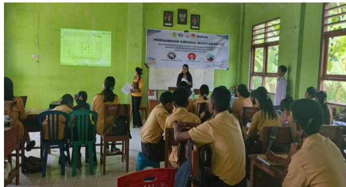
Gambar 3. Kegiatan Pelatihan Penulisan Karya Tulis Ilmiah di SMAK Santa Maria Fatima Betun.

Pelaksanaan kegiatan pengabdian kepada masyarakat dilakukan dalam 6 bulan kegiatan yakni terlaksana mulai bulan Juni 2025 hingga Desember 2025, di SMAK Santa Maria Fatima Betun Kecamatan Malaka Tengah Kaupaten Malaka. Kegiatan ini berupa sesi pelatihan intensif yang difokuskan pada teknik penulisan karya ilmiah bagi siswa. Dalam kegiatan ini juga melibatkan mahasiswa pada program studi pendidikan sejarah sebanyak 3 Orang, dan mereka bertindak sebagai fasilitator, membimbing siswa secara langsung melalui materi dan praktik penulisan. Pendekatan ini diambil untuk memaksimalkan waktu pelatihan, sehingga siswa Kelas XII SMAK St. Maria Fatima Betun dapat meningkatkan kemampuan literasi ilmiahnya secara efektif.