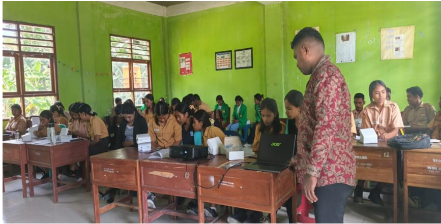
Gambar 4. Evaluasi Kegiatan.