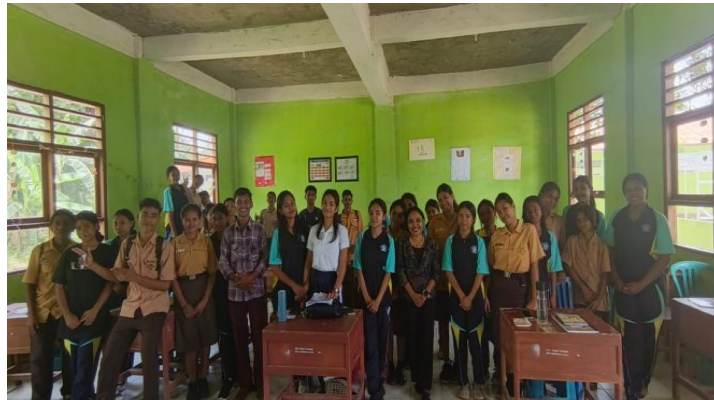
Gambar 2. Kegiatan Observasi dan Wawancara yang dilakukan oleh Tim Pengabdian Kepada Masyarakat

Pada tahap perencanaan ini, langkah pertama yang dilakukan oleh tim pengabdian Masyarakat STKIP Sinar Pancasila yakni melakukan observasi di sekolah SMAK Santa Maria Fatima Betun yang berada di Kecamatan Malaka Tengah, Kabupaten Malaka. Tujuan dari kegiatan observasi ini untuk melakukan mengidentifikasi permasalahan dan kebutuhan dari mitra yang kemudian dikembangkan melalui kegiatan pengabdian kepada masyarakat.