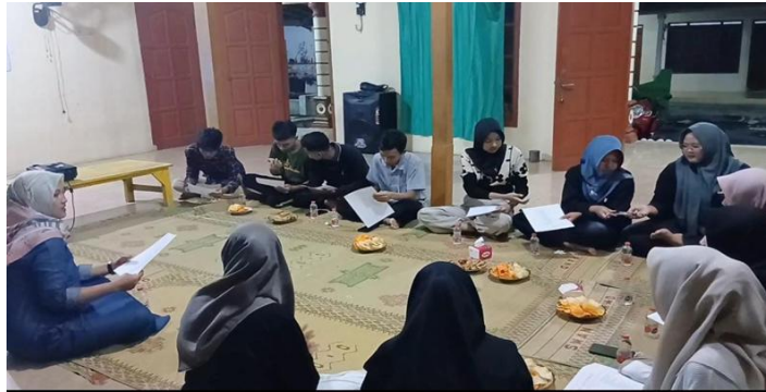
Gambar 5. Fun-games.

yang menang. Hal ini mampu menunjukkan antusias mereka dan mampu menumbuhkan rasa kebersamaan diantara peserta.