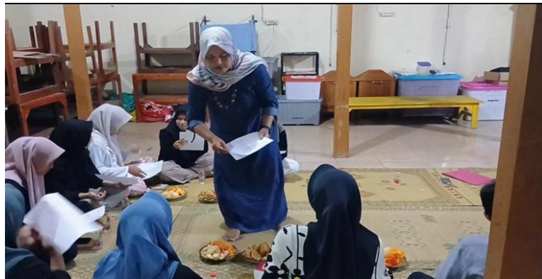
Gambar 2. Pre-test.

pemahaman terhadap kasus bullying . Setelah sesi paparan kemudian diteruskan dengan diskusi interaktif untuk memberikan kesempatan pada peserta lebih mendalami uneg-uneg yang mereka temukan. Setelah pelaksanaan diskusi berlangsung dilanjutkan sesi post-test untuk mengevaluasi sejauh mana kegiatan yang dilaksanakan bisa memberikan pemahaman dan dampak positif bagi peserta dalam menjawab pertanyaan.