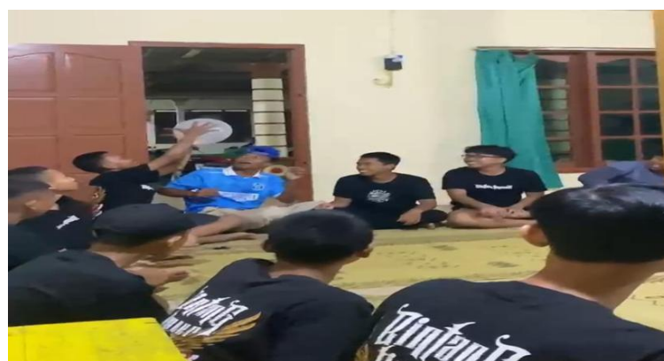
Gambar 4. Post-test.

Kemudian untuk tanggal 15 di hari kedua dilakukan kegiatan fun games dengan harapan peserta dapat memepererat hubungan mereka sesama remaja dengan kegiatan yang positif. Fun games dikemas dengan lomba permainan berkelompok yang kemudian diberikan hadiah bagi