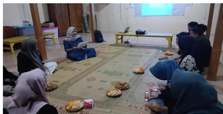
Gambar 3. Paparan Materi.