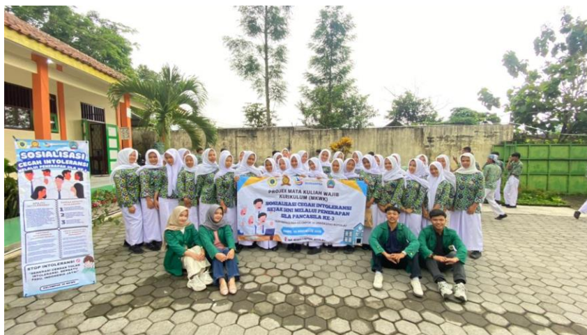
Gambar 4 . Sesi Foto Bersama

berkontribusi pada peningkatan kualitas hasil belajar siswa.