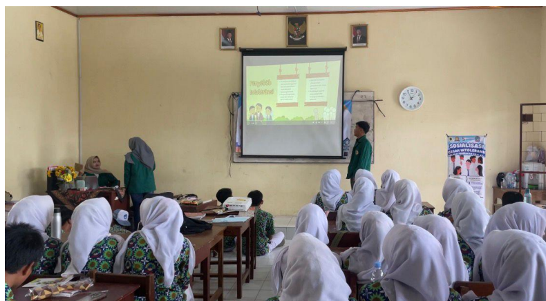
Gambar 1. Penyampaian Materi Sosialisasi

Program diawali oleh sambutan pembuka sekaligus pengenalan seluruh pihak yang terlibat. Setelah itu pre- test untuk mengetahui pengetahuan siswa tentang intoleransi setelah itu penyampaian materi utama mengenai upaya pencegahan intoleransi melalui implementasi Sila Ketiga Pancasila dilakukan menggunakan presentasi visual (PPT) yang diselingi dengan ice breaking. Tujuan dari sosialisasi ini adalah mendistribusikan informasi secara komprehensif, menyebarkan nilai-nilai kebaikan, dan memberikan edukasi yang terstruktur kepada seluruh peserta.