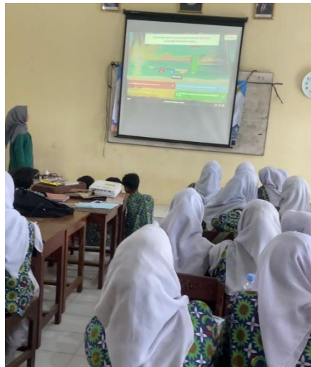
Gambar 2. Sesi Pre - Test & Post - Test

Setelah seluruh materi selesai disampaikan, siswa kembali mengerjakan Post-test dilaksanakan dengan pertanyaan serupa seperti Pre-test. Analisis perbandingan kedua hasil tes dilakukan guna mendeteksi peningkatan pengetahuan. Dengan cara ini, efektivitas kegiatan sosialisasi dapat dinilai secara jelas dan terukur.