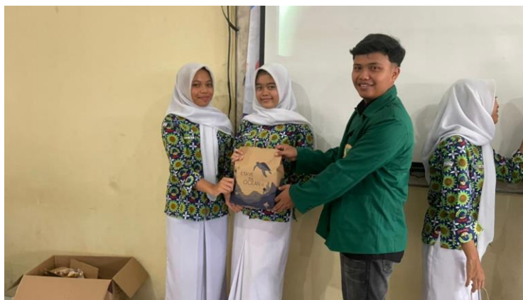
Gambar 3 . Penyerahan Hadiah

Sesudah penyampaian materi selesai dilanjut dengan Post – Test game interaktif Kahoot dengan soal yang sama hasil menunjukkan pemahaman siswa meningkat setelah penyampaian materi. 3 Siswa peringkat teratas mendapatkan hadiah sebagai penghargaan.