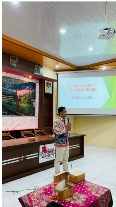
Gambar 4. Pengenalan Media Studi Kelayakan Usaha.