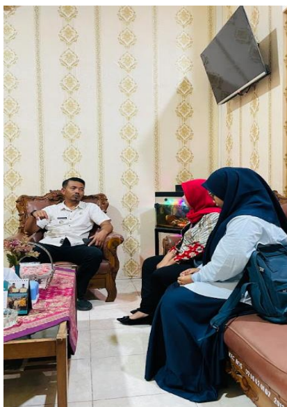
Gambar 1. Sosialisasi Kegiatan.

membahas rencana pelaksanaan program, ruang lingkup kegiatan, serta dukungan kelembagaan yang diperlukan. Pertemuan ini bertujuan untuk menyelaraskan program pengabdian dengan kebutuhan dan prioritas pembangunan desa di wilayah Kecamatan Bendosari. Selain itu, diskusi juga mencakup identifikasi potensi desa serta peran strategis pemerintah kecamatan dalam mendukung keberhasilan program.