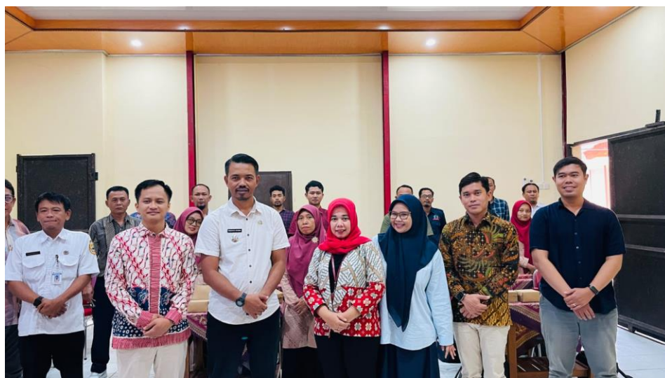
Gambar 2. Foto bersama Peserta Kegiatan Pengabdian kepada Masyarakat.