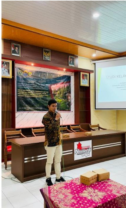
Gambar 3. Materi pemetaan potensi desa, manajemen keuangan, serta analisis kelayakan usaha.

Kegiatan pada Gambar 3 menunjukkan pelaksanaan sesi pelatihan yang berfokus pada penyampaian materi inti dalam program Kelas Keuangan Desa. Materi yang disampaikan meliputi pemetaan potensi ekonomi desa, manajemen keuangan usaha desa, serta analisis kelayakan usaha sebagai dasar pengambilan keputusan investasi desa. Pada sesi pemetaan potensi desa, peserta diberikan pemahaman mengenai teknik identifikasi dan pengelompokan potensi ekonomi lokal berbasis data, termasuk komoditas unggulan, UMKM, serta peluang pasar yang dapat dikembangkan. Selanjutnya, pada materi manajemen keuangan, peserta dilatih untuk menyusun proyeksi keuangan, penganggaran, serta pencatatan transaksi usaha secara sistematis dan akuntabel.