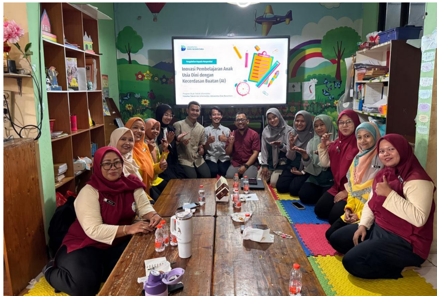
Gambar 3. Dokumen Foto 1