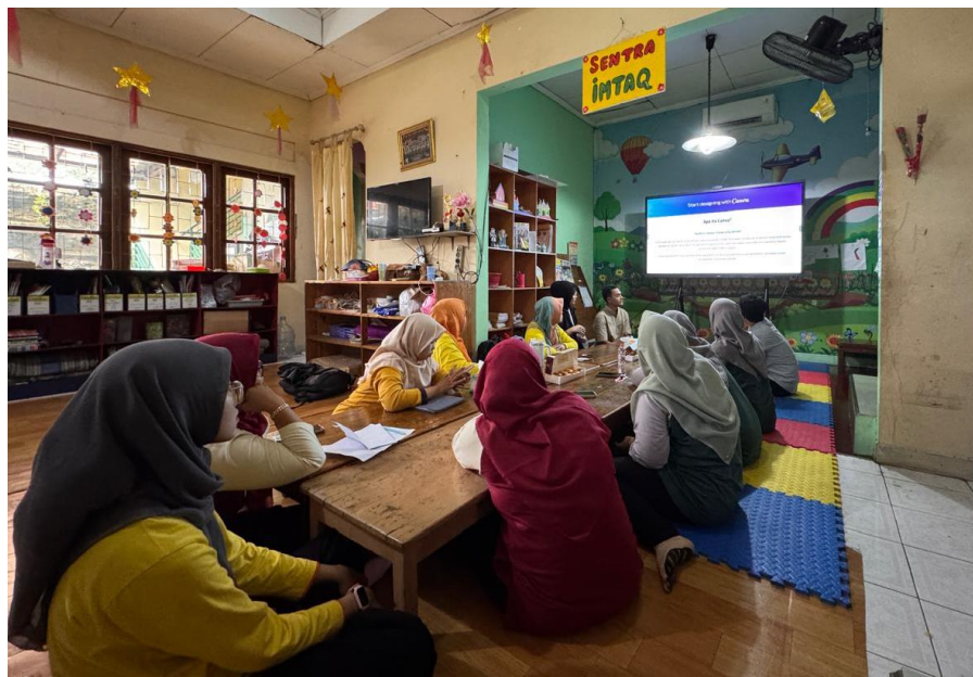
Gambar 5. Dokumen Foto 3