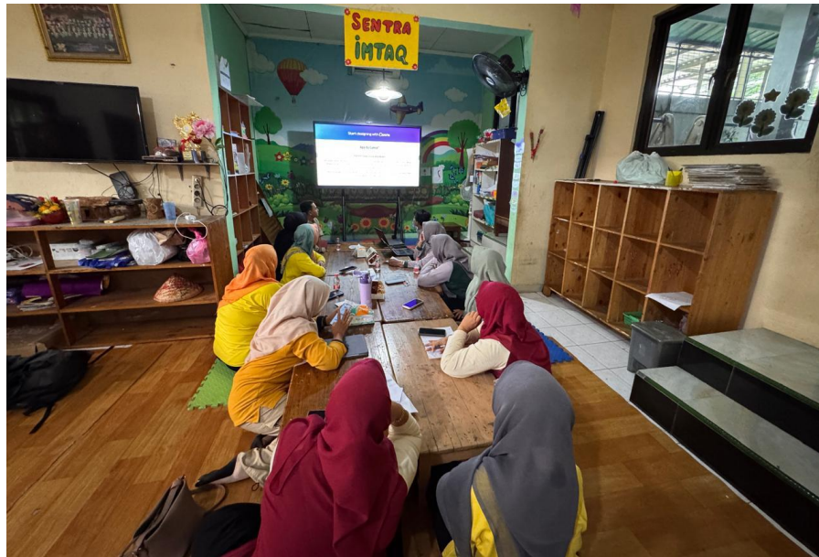
Gambar 4. Dokumen Foto 2