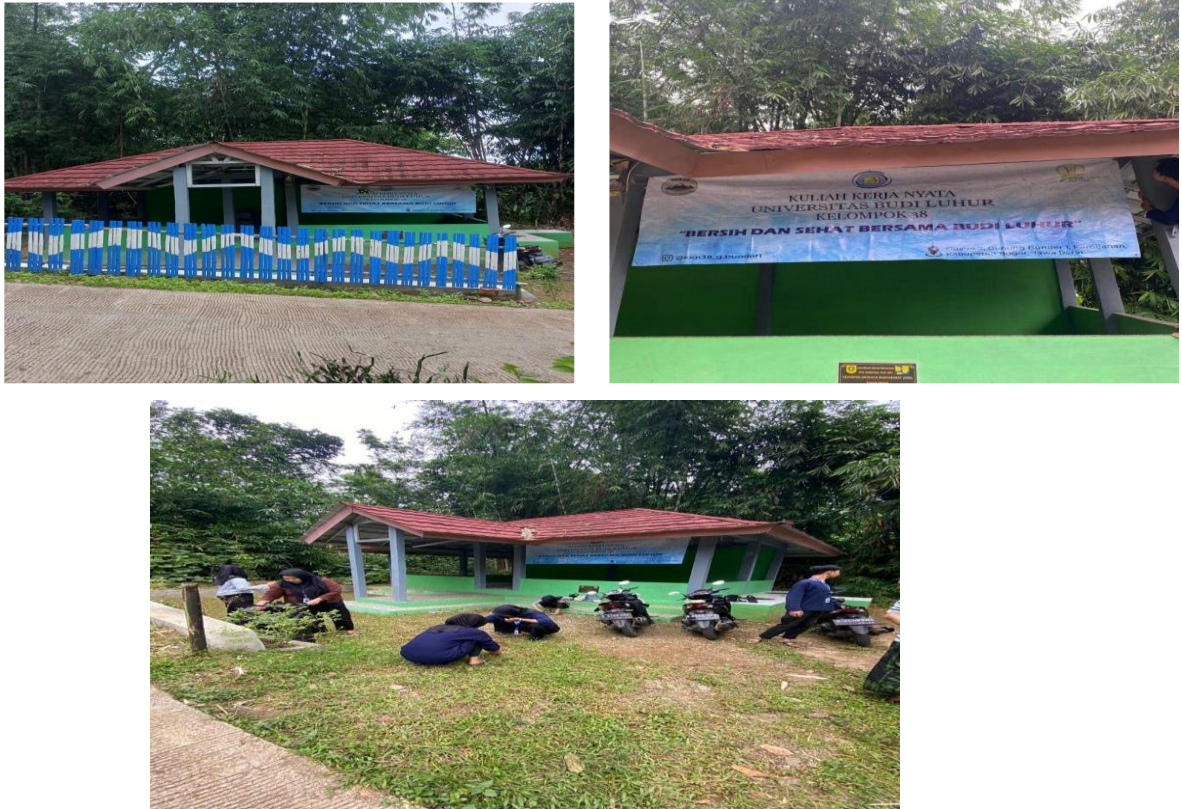
Gambar.2 Membersihkan lingkungan IPAL

bersih mendorong munculnya rasa memiliki dan tanggung jawab kolektif masyarakat terhadap fasilitas bersama.