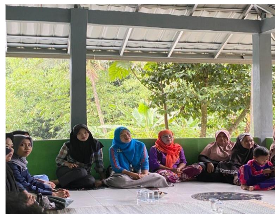
Gambar.1 Sosialisasi Tentang Kampung Ramah Lingkungan

Pembangunan Kampung Ramah Lingkungan yang dipusatkan di Instalasi Pembuangan Air Limbah (IPAL) merupakan bentuk pemanfaatan fasilitas publik sebagai media edukasi dan pemberdayaan masyarakat. Sebelum kegiatan kegiatan pengabdian masyarakat dilaksanakan, IPAL belum dimanfaatkan secara optimal dan kurang terawat. Melalui kegiatan menghias dan merapikan IPAL, seperti pembuatan pagar, penanaman tanaman hias, serta pemanfaatan limbah botol plastik menjadi kerajinan, terjadi perubahan signifikan pada fungsi dan citra ruang tersebut. Secara teoritik, transformasi ruang fisik ini dapat dipahami sebagai pemicu perubahan sosial, di mana lingkungan yang tertata dan