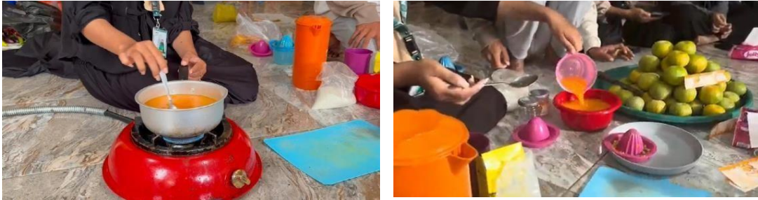
Gambar 2. Dokumentasi proses pembuatan.

dengan api kecil selama 30 menit; 5) masukan gula pasir sebanyak 7 sendok makan; 6) Larutkan 1 sendok teh tepung maizena; 7) Tuangkan larutan tepung kedalam air jeruk yang sudah mendidih; 8) Aduk terus menerus selama 1 jam sampai tekstur mengental; 9) Tunggu sampai dingin suhu ruang lalu kemas kedalam botol yang sudah di sterilkan;