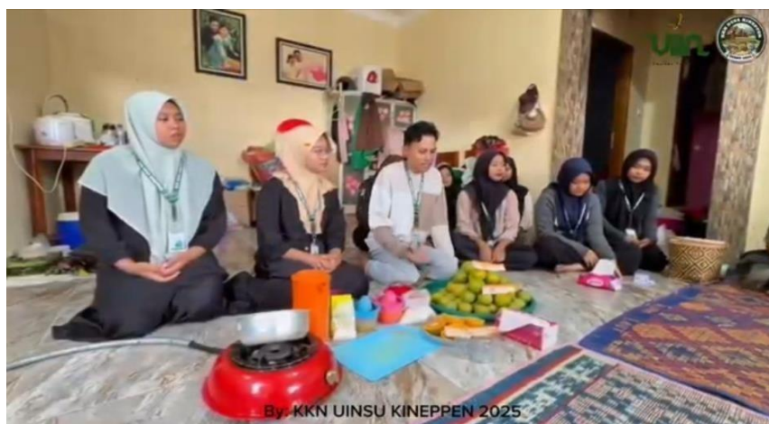
Gamabar 3. Tahapan Pelaksanaan Sosialisasi.

Pelaksanaan adalah tahap kedua dari pengabdian. Pada tanggal 28 Agustus 2025, di Posko kami di Desa Kineppen, ada acara pelatihan sosialisasi dan optimasi jeruk lokal untuk membuat selai jeruk. Pada tahap sosialisasi pembuatan selai jeruk ini, diharapkan para ibu yang telah terlibat sebelumnya dapat memahami apa yang telah kami lakukan hingga saat ini.