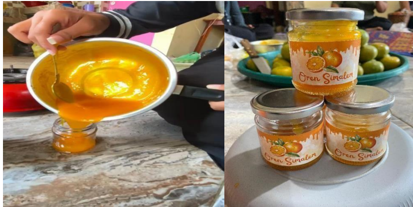
Gambar 4. Selai Jeruk Yang Sudah Dikemas.

kebersihan dalam proses pengemasan dan memberikan nama kemasan yang dijelaskan dengan jelas.