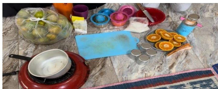
Gambar 1. Persiapan Alat dan Bahan untuk Tahapan.

Pada tahap pelaksanaan, pengabdian menyediakan alat, bahan, dan media presentasi untuk menjelaskan proses pembuatan selai jeruk kepada para ibu peserta kegiatan. Pendekatan pelatihan berbasis praktik langsung dengan penyediaan peralatan dan bahan terbukti efektif dalam meningkatkan keterampilan pengolahan pangan masyarakat desa (Lestari et al., 2020). Dengan demikian, kegiatan ini tidak hanya berorientasi pada transfer pengetahuan, tetapi juga mendorong kemandirian ekonomi melalui pemanfaatan sumber daya lokal secara optimal.