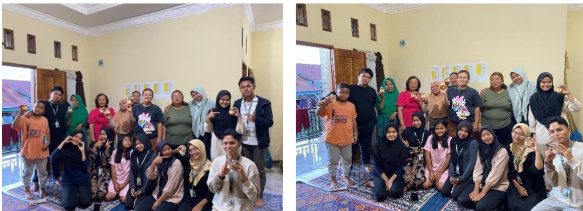
Gambar 5 Tahapan Akhir Kegiatan.

Selain itu, ibu-ibu Desa Kinnepen menyatakan bahwa pelatihan pembuatan selai jeruk sangat bermanfaat untuk meningkatkan produksi produk jeruk selain produk mentah, menciptakan peluang tambahan, dan meningkatkan status ekonomi jeruk Desa Kinnepen. Mereka juga percaya bahwa diversifikasi produk ini mengurangi risiko kerugian finansial akibat fluktuasi harga dan hasil jeruk.