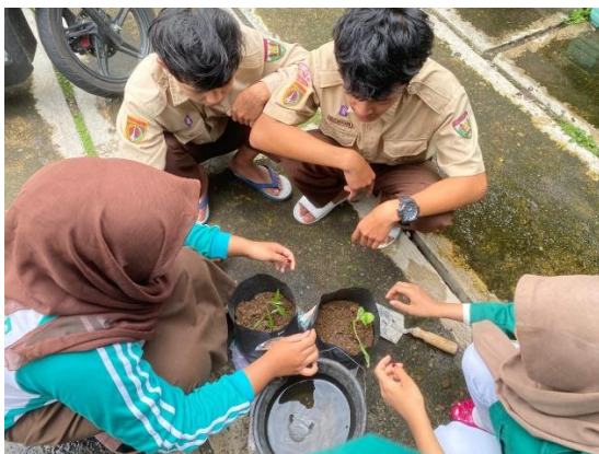
Gambar 1. Sesi Menanam

sekarang mampu membuat konsep ketahanan pangan di pekarangan rumah untuk ketahanan pangan yang sehat.