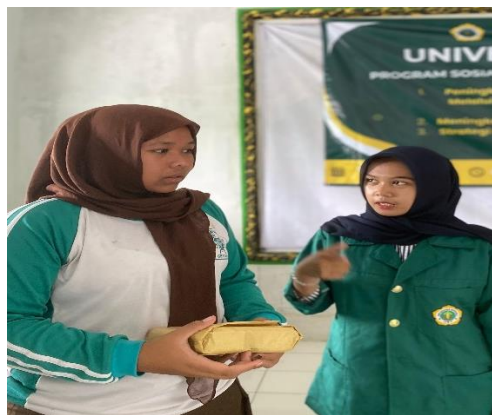
Gambar 2. Sesi Wawancara