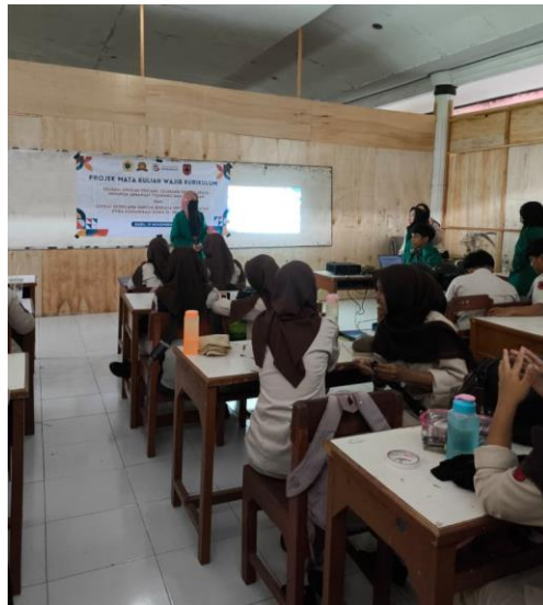
Gambar 1. Penyampaian Materi Etika Komunikasi Digital

memandang media sosial sebagai ruang bebas tanpa batasan. Namun seiring penjelasan dan contoh kasus yang diberikan, mereka mulai memahami bahwa setiap tindakan di ruang digital memiliki konsekuensi sosial. Perubahan cara pandang ini sejalan dengan pendapat yang menyatakan bahwa literasi digital tidak hanya berkaitan dengan penguasaan teknologi, tetapi juga berhubungan dengan pembentukan nilai dan kesadaran etis dalam berkomunikasi (Paramitasari, Antara, Triwijaya, & Werang, 2025). Temuan ini secara tidak langsung memperlihatkan munculnya dasar kemampuan cerdas berbicara, yaitu kemampuan mempertimbangkan dampak dari pesan yang disampaikan.