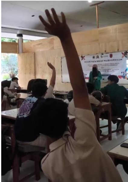
Gambar 2. Diskusi dan Interaksi Siswa selama Kegiatan

Dalam sesi diskusi, siswa banyak menceritakan pengalaman pribadi, seperti saat tanpa sengaja membagikan informasi teman atau ketika memberikan komentar spontan yang kemudian menyinggung orang lain. Dari berbagai cerita tersebut terlihat bahwa mereka mulai mampu menilai mana perilaku yang sesuai dan mana yang melanggar etika komunikasi digital. Proses refleksi ini sejalan dengan temuan sebelumnya yang menegaskan bahwa literasi digital dapat menjadi sarana untuk membangun sikap yang lebih bertanggung jawab dalam menggunakan media social (Maifianti, Hidayati, & Mauliansyah, 2021). Kemampuan reflektif tersebut merupakan bagian dari pembentukan sikap berkomunikasi secara bijak, yang sangat penting dalam menghadapi dinamika komunikasi di era digital.