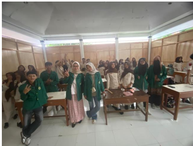
Gambar 3. Foto Bersama Tim Pengabdian dan Peserta

Meskipun hasilnya cukup menggembirakan, perubahan yang terjadi masih perlu terus dipantau. Tanpa adanya pembiasaan, siswa berpotensi kembali pada pola lama, terutama ketika berada di ruang digital yang minim kontrol. Karena itu, pendampingan lanjutan serta penguatan literasi digital di sekolah tetap diperlukan. Dengan demikian, nilai-nilai yang mereka peroleh tidak hanya bertahan sementara, tetapi benar-benar menjadi bagian dari kebiasaan komunikasi mereka baik di sekolah maupun di media sosial.