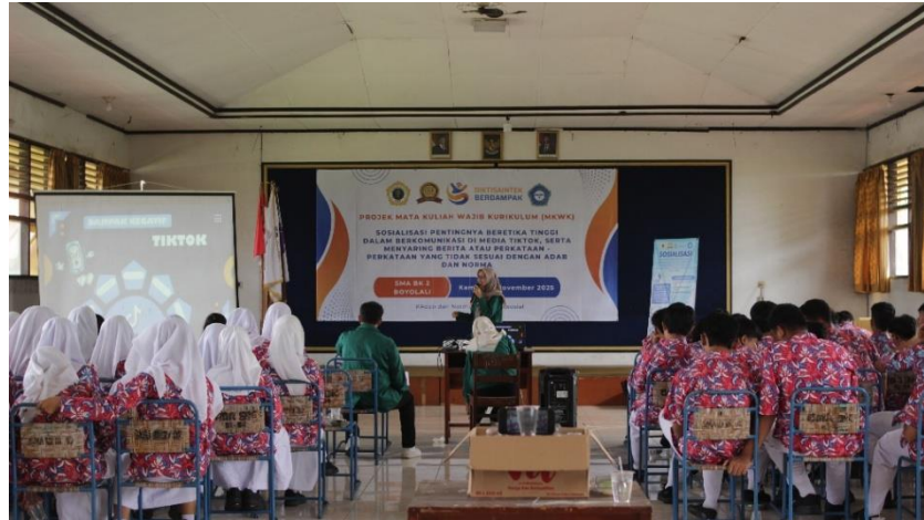
Gambar 1. Sosialisasi