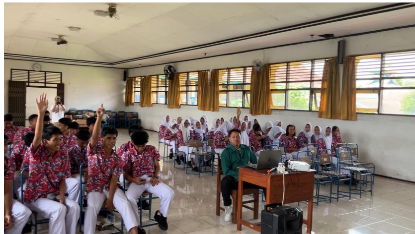
Gambar 2. Sesi Tanya Jawab