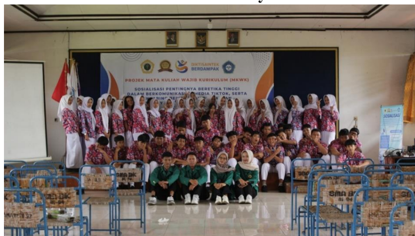
Gambar 3. Foto Kenang-Kenangan