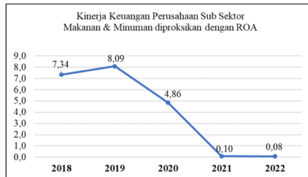
Gambar 2. Kinerja keuangan perusahaan manufaktur food and beverage sub sector tahun 2018-2022.