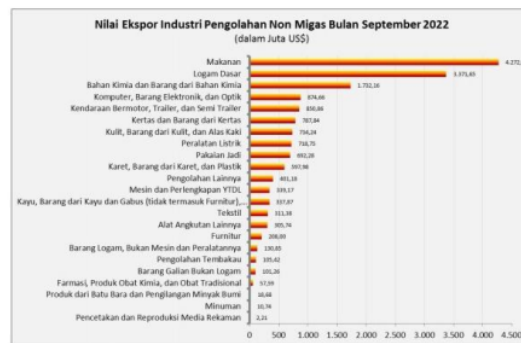
Gambar 1. Nilai Ekspor Berdasarkan Jenis Industri Bulan September 2022

Berdasarkan data Kementerian Perindustrian, terlihat bahwa subsektor makanan dan minuman mempunyai posisi penting sebagai penyumbang utama pertumbuhan perekonomian bangsa secara keseluruhan. Berdasarkan data Kementerian Perindustrian, "sektor makanan dan minuman (mamin) mengalami pertumbuhan sebesar 3,57% pada triwulan III tahun 2022". Angka tersebut meningkat dibandingkan periode yang sama tahun sebelumnya yang dilaporkan pada 3,49%. Fenomena ini menunjukkan korelasi yang kuat dengan tren peningkatan volume ekspor, khususnya kuantitas. Yang dimaksud dengan "ekspor" adalah tindakan pengiriman barang atau jasa yang diproduksi di suatu negara. Pada bulan Januari hingga September 2022, industri makanan dan minuman mencatat pencapaian yang patut dicatat karena ekspornya, termasuk minyak sawit, mencapai jumlah yang cukup besar yaitu sebesar US$36 miliar. Sebaliknya, "impor makanan dan minuman pada periode yang sama sebesar US$12,77 miliar". Data ini menunjukkan neraca perdagangan yang menguntungkan bagi industri makanan dan minuman, sehingga menyoroti signifikansi ekonominya. "Pada triwulan I tahun 2022, industri makanan dan minuman mendominasi lebih dari sepertiga atau 33,77% Produk Domestik Bruto (PDB) sektor pengolahan nonmigas." Pada triwulan II tahun 2022, PDB sektor makanan dan minuman mengalami peningkatan signifikan hingga mencapai Rp 200,26 triliun. Angka ini tumbuh 3,68% dibandingkan periode yang sama tahun sebelumnya Rp193,16 triliun (Kremenprin.go.id, November 2022).